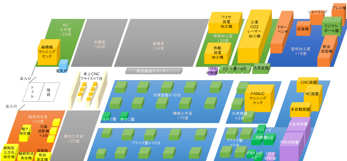
工作実験室（59号館2F西側）機械配置図